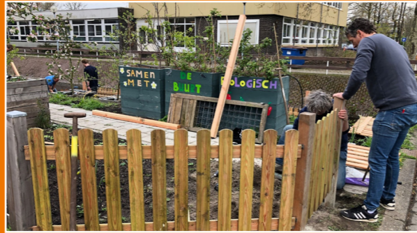
Sociaal beheerder Wichert Brommer