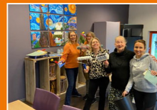
Wijkcentrum Linqenda, Nieuw-Vennep