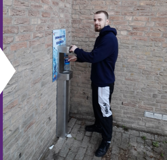
Lissersbroek - De Meerkoet & De Nooduitgang