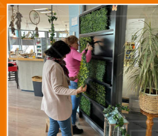
Wijkgebouw De Amazone, Hoofddorp