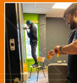
Jongeren centrum Flex C, Hoofddorp