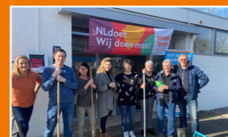
Dorpshuis Marijke, Burgerveen