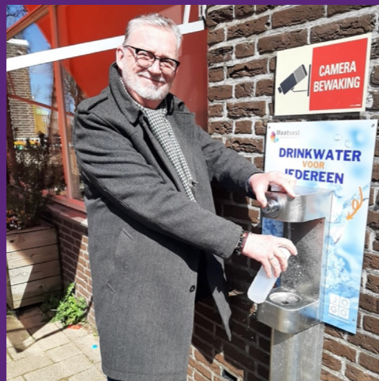
Hoofddorp - De Nieuw Silo & J.C. De Silo